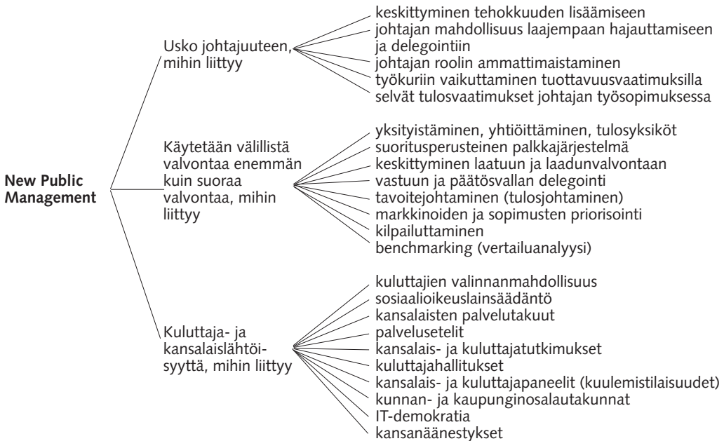
Kuvio 2. New Public Managementin perusosat