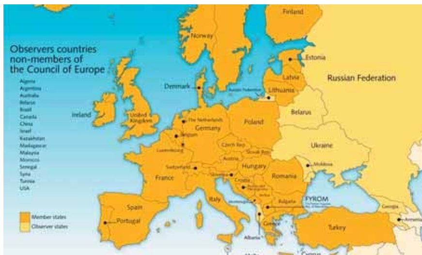
Euroopan farmakopean jäsenmaat on merkitty karttaan tummemmalla keltaisella (yhteensä 37 jäsentä mukaanlukien EU). Vaaleammalla keltaisella on merkitty tarkkailijat (yhteensä 23 Euroopasta ja sen ulkopuolelta, mukana WHO).

tistä nopeammin. Näissä olosuhteissa vuonna 1990 perustettiin ICH-foorumi (International Conference on Harmonisation of Technical Requirements for Registration of Pharmaceuticals for Human Use), jonka tehtäväksi tuli lääkevalmistukseen ja -valvontaan liittyvien vaatimusten ja ohjeiden kansainvälinen harmonisointi.