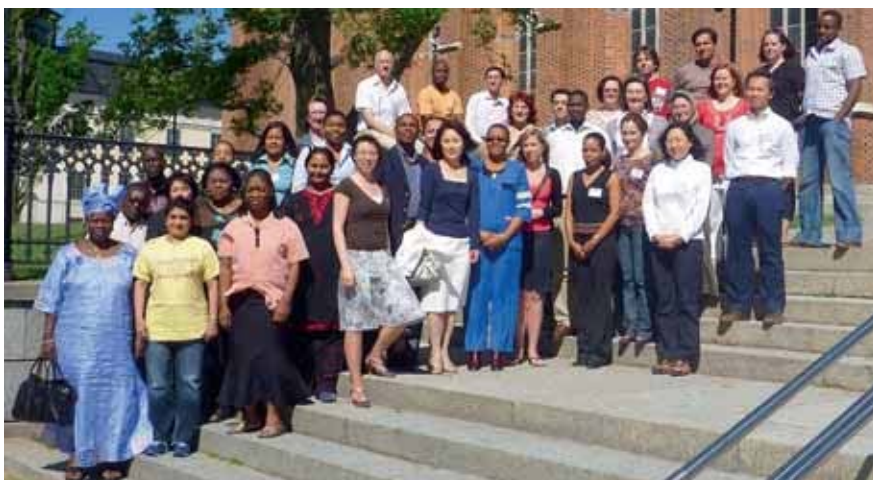
Uppsalassa järjestetyn tämän vuotisen lääketurvakurssin osallistajat yhteiskuvassa. Kurssi pidettiin touko-kesäkuun vaihteessa.

"Points to consider on stability testing of homeopathic medicinal products" -ohje on julkaistu ja se löytyy Euroopan lääkevirastojen päälliköiden (HMA) verkkosivulta osoitteesta http://www.hma.eu/79.html . Samalta verkkosivulta löytyvät ensimmäiset turvallisten laimennosten listan valmisteluun liittyvät dokumenttiluonnokset "Introduction to the list of first safe dilutions", "Structure of the list of first safe dilutions" ja "Assessment report template first safe dilution" sekä homeopaattisen käytön määrittelyyn liittyvä dokumenttiluonnos "Points to consider on the justification of homeopathic use".