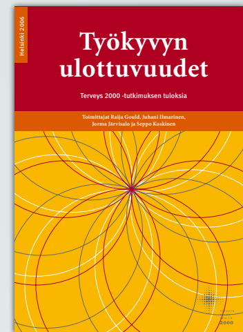
Työkyvyn ulottuvuudet Terveys 2000 -tutkimuksen tuloksia 366 sivua, hinta 25 €, Hakapaino 2006, Helsinki ISBN 951-691-047-5 (sid.) ISBN 951-691-048-3 (PDF)