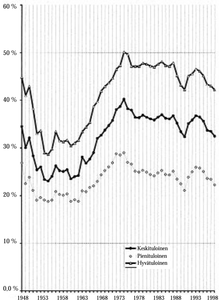
Kuvio 1. Reaalinen tuloveroaste 1948–1999

jaksoksi, jolloin toisaalta sosiaaliturvassa ja julkisissa palveluissa ei tapahtunut kovin merkittävää laajentumista. Tuloverotuksen yleinen alentaminen oli mahdollista.