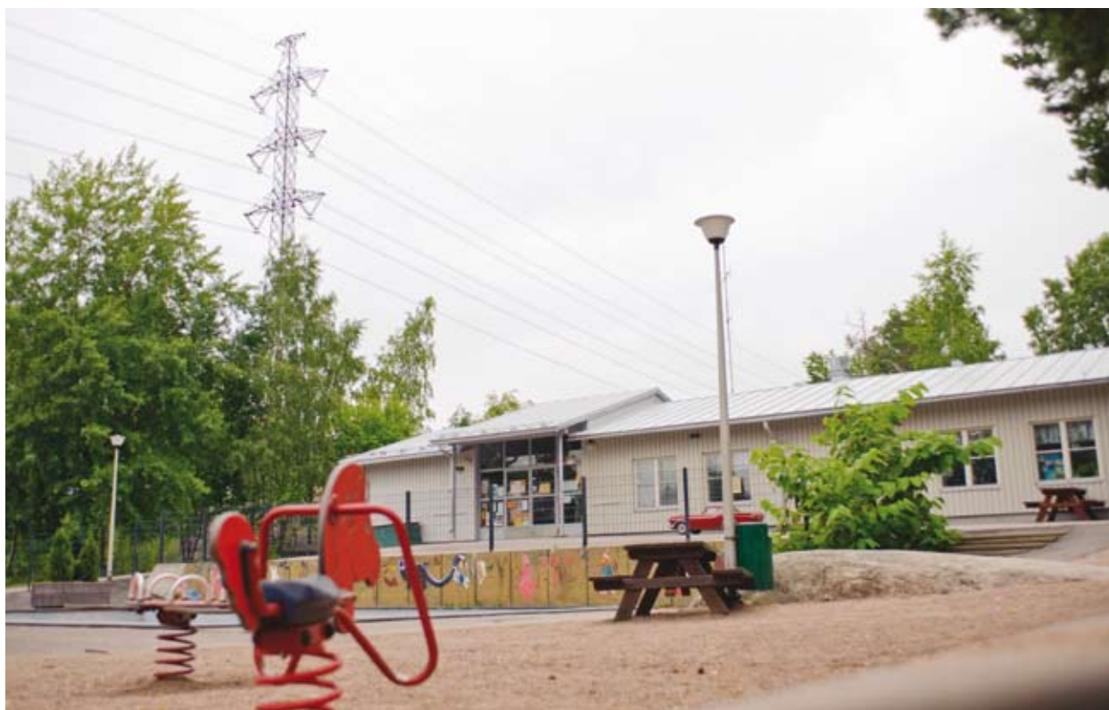
Päiväkodit ja koulut on syytä sijoittaa riittävän matkan päähän voimajohdoista. Suositeltava vähimmäisetäisyys riippuu siitä, kuinka korkealla voimajohdot ovat ja kuinka suuret virrat johdoissa kulkevat.

Sähkö- ja magneettikentät on huomioitava maankäytössä. Kentät eivät kuitenkaan estä alueiden hyödyntämistä. Yllä olevissa taulukoissa on annettu esimerkkejä siitä, millaisia toimintoja voi sijoittaa erilaisiin sähkö- ja magneettikenttiin. Magneettikenttiä eri etäisyyksillä voimajohdosta voi arvioida karkeasti sivun 9 taulukosta. Tarkemman tapauskohtaisen arvion tekemiseen tarvitaan voimajohdon tekniset tiedot. Arviointiin on saatavissa apua esimerkiksi Säteilyturvakeskuksesta.