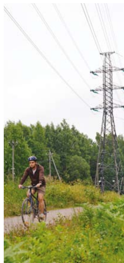
Voimajohtojen alla voi turvallisesti esimerkiksi kävellä, poimia marjoja, pyöräillä tai ajaa autolla.

Haittavaikutusten ehkäisemiseksi sähkö- ja magneettikentille on annettu altistumisrajat. Voimajohtojen väestölle aiheuttamaa altistumista koskevat rajat on kirjoitettu suosituksiksi sosiaali- ja terveysministeriön asetukseen 294/2002. Voimajohtojen taajuudella (50 Hz) raja-arvot ovat