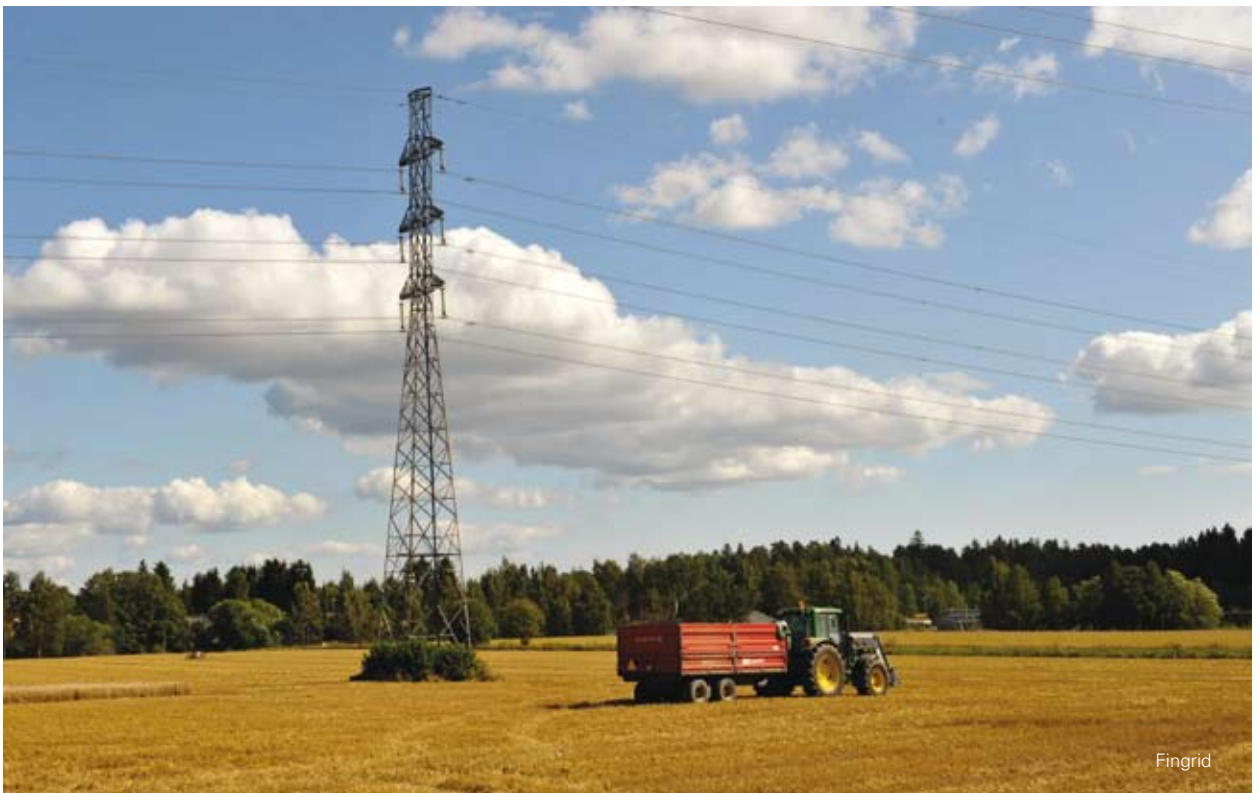
Voimajohdon alla olevia alueita voi käyttää laidunmaana ja niillä voi tehdä maataloustöitä. Korkeiden työkoneiden turvallisesta käytöstä kannattaa kysyä voimajohtoyhtiöltä.

Varmuutta leukemian ja magneettikenttien yhteydestä tuskin saadaan vielä pitkään aikaan. Tämä epävarmuus on omiaan aiheuttamaan ihmisissä huolta, etenkin kun kyseessä on lapsiin kohdistuva riski. Lisäksi asuintalot ovat ihmisille merkittäviä investointeja. Tämän vuoksi STUK suosittelee välttämään pysyvään oleskeluun tarkoitettua rakentamista alueilla, joissa magneettivuon tiheys ylittää jatkuvasti edellä mainitun noin 0,4 \mu\text{T} tason. Kotien lisäksi erityisesti lasten oleskeluun tarkoitettut tilat, kuten päiväkodit ja koulut, on syytä rakentaa riittävän matkan päähän voimajohdoista. Epäselvissä tapauksissa Säteilyturvakeskus voi antaa lausuntoja esimerkiksi kaavoitusviranomaisille.