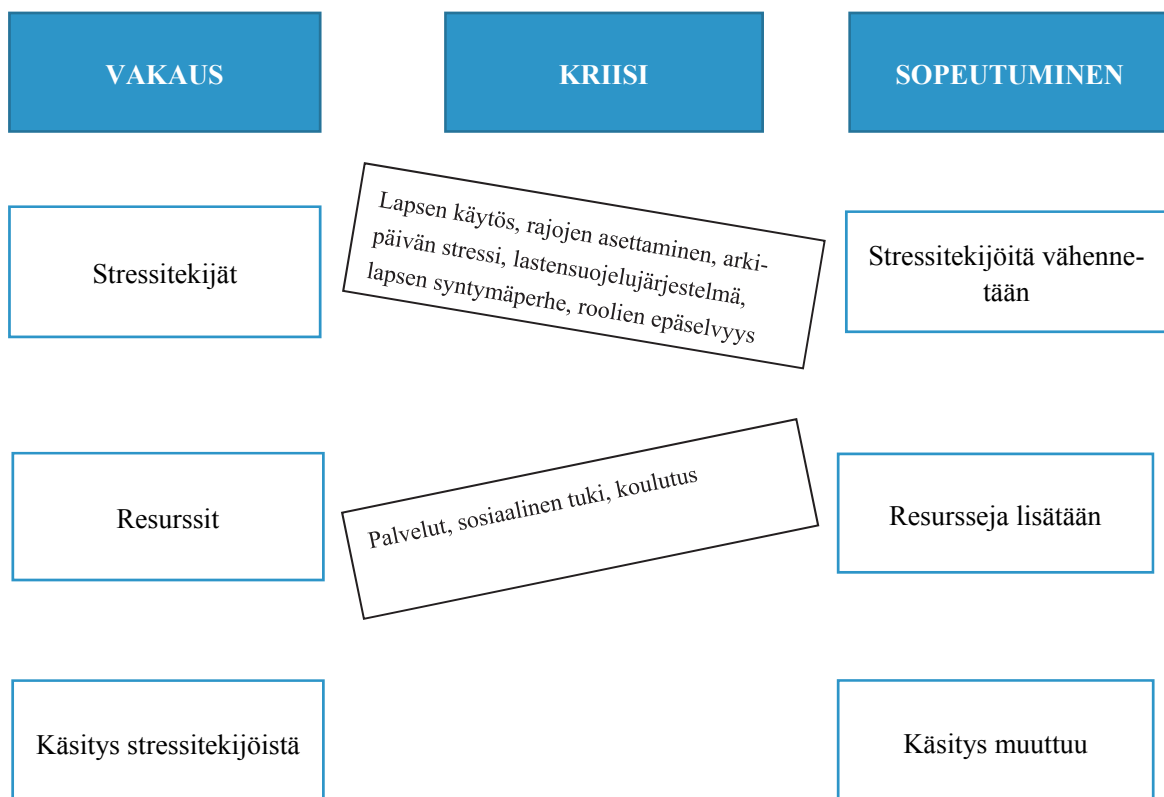
Kuvio 3. FAAR-malli perhehoidon viitekehyksenä (soveltaen Megahead & Soliday 2013)

Megahead ja Soliday (2013) esittelevät ns. FAAR-mallin (Family adjustment and adaptation response) perhehoidon käsitteellistämiseksi. He esittävät, että sijaisperheen sopeutuminen stressiin on kolmen tekijän yhteisvaikutuksen tulosta: perheen stressitekijät, perheen resurssit ja perheenjäsenten yksilölliset käsitykset stressitekijöistä ja resursseista. Perhesysteemi on vakaa, kun resurssit tasapainottavat stressitekijöitä.