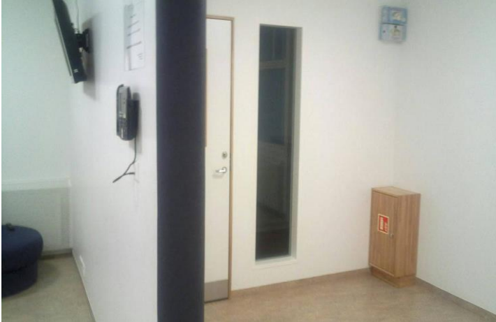
Oikeuspsykiatrisella osastolla sijaitseva erillinen siipi aggressiivisille potilaille, Reykjavik, Islanti, 2013