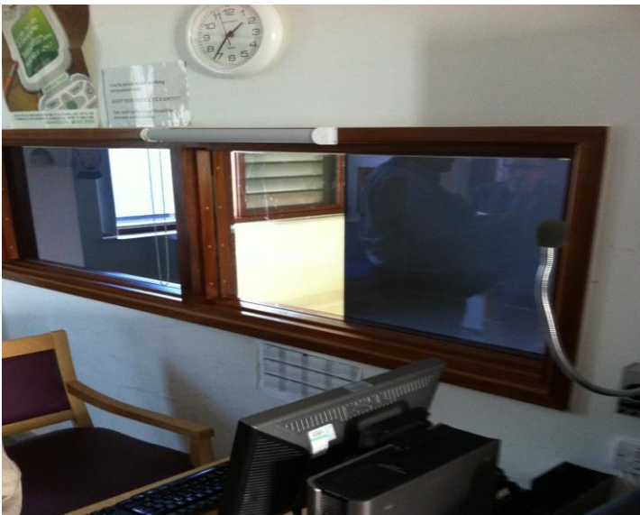
Eristyshuoneen valvontahuone, Psychiatric Intensive Care Unit, Lontoo, 2013