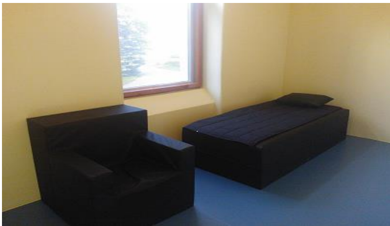
Eristysuone, Halikon sairaala 2011