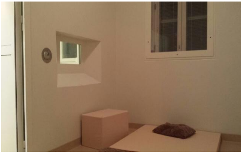
Eristysluone, Satakunnan sairaanhoitopiiri, nuorten suljettu osasto