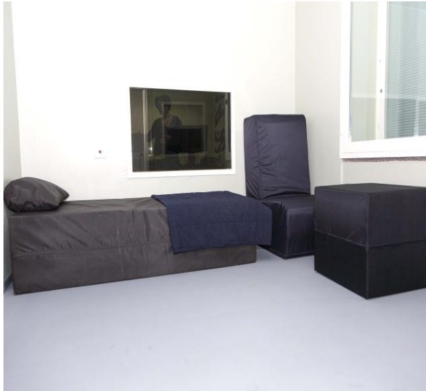
Eristysuone, Lapin sairaanhoitopiiri, psykiatrian klinikka 2016