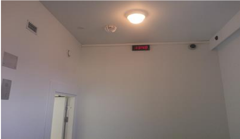
Eristysluone, Halikon sairaala 2011