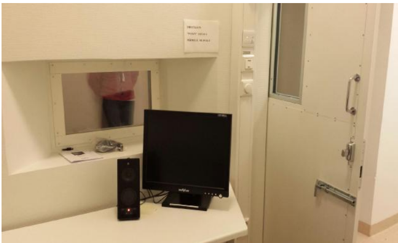
Eristysluoneen valvonta, Satakunnan sairaanhoitopiiri, nuorten suljettu osasto