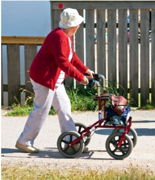
Fyysisellä toimintakyvyllä tarkoitetaan ihmisen fyysisiä edellytyksiä selviytyä niistä tehtävistä, jotka hänen arjessaan ovat tärkeitä.

kiksi Suomessa ovissa ei ole nuppeja vaan kahvat, joten ”ovennupit” korvattiin sanalla ”ovenkahvat”. Myös sana ”bathing” käännettiin yleisemmäksi termiksi ”peseytyminen” ja ”turning faucets” käännettiin ”vesihanojen avaamiseksi”, koska kaikkia hanoja ei avata kiertämällä.