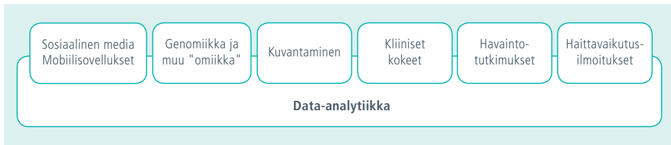
Kuvio 1. Big datan keskeiset tietolähteet lääkealalla ja HMA/EMA Big Data Task Forcen työryhmät.

resurssien käyttöä. Kuvantamistutkimuksista (esim. MRI, fMRI, PET, MEG) kertyvät aineistot mahdollistavat täysin uusia lähestymistapoja esimerkiksi neurodegeneratiivisten sairauksien tutkimuksessa.