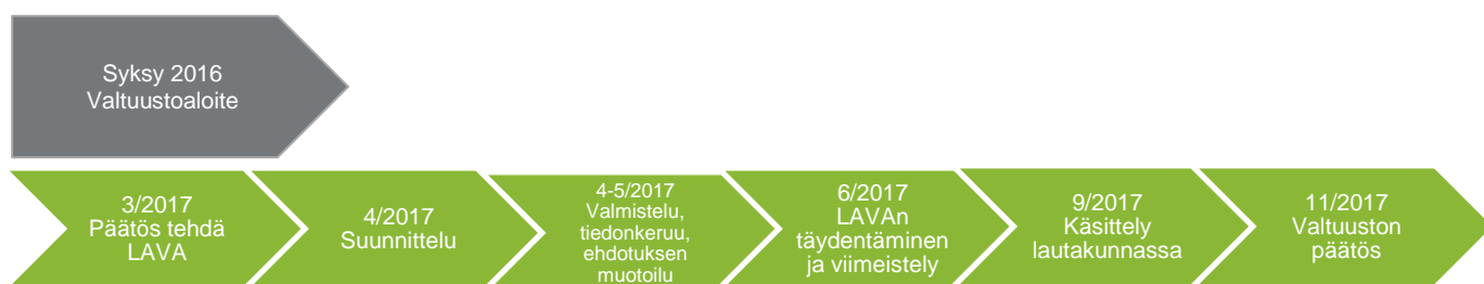
Kuvio 3. Iltapäivätoiminnan maksujen alentaminen Jyväskylässä.

Jyväskylän LAVAssa vaikuttaa vahvasti perusopetuslaki, YK:n lapsen oikeuksien sopimus sekä lasten ja lapsiperheiden yhdenvertaisuus. Tutkimustiedon kautta LAVA peilaa aamu- ja iltapäivätoiminnan merkitystä lapseen kohdistuviin psykososiaalisiin vaikutuksiin. Jyväskylän kaupungin hyvinvointikertomuksen keskeisiä kehittämisen painopistealueita ovat yksinäisyyden vähentäminen, eriarvoisuuden ja polarisaation loiventaminen sekä palvelujen saatavuus ja saavutettavuus. Lapsen osallistumattomuus iltapäivätoimintaan ja yksin kotona oleminen aiheuttivat arvioinnin perusteella huolta sekä vanhemmille että toiminnanjärjestäjille.