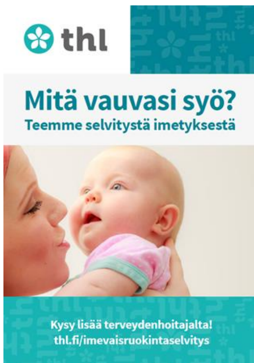
Kuva 1. Tutkimuksesta kertova juliste.

järjestettiin kuusi samansisältöistä Skype-tapaamista, joissa tutkija esitteli tiedonkeruun käytännön toteuttamisen ja vastasi kysymyksiin. Tiedonkeruun aikana osallistuneille kunnille lähetettiin kerran viikossa sähköposti, jossa kannustettiin tiedonkeruun jatkamiseen ja esitettiin sen hetkiset vastaajamäärät kunnittain. Tutkija oli tiedonkeruun aikana tavoitettavissa sähköpostitse ja puhelimitse klo 7.30–16.30 välisenä aikana arkipäivisin.