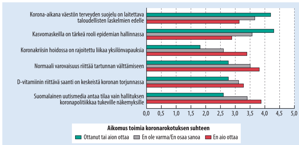
KUVA 2. Näkemykset koronaepidemian torjuntatoimista ja uutismedian toiminnasta koronakriisissä (keskiarvo) eri koronarokotusaikomusluokissa maaliskuussa 2021 (n = 1 151). Keskiarvon laskemisessa vastaukset koodattiin seuraavasti: ”Täysin eri mieltä” = 1, ”Jokseenkin eri mieltä” = 2, ”En osaa sanoa” = 3, ”Jokseenkin samaa mieltä” = 4 ja ”Täysin samaa mieltä” = 5.

tus pimittää tietoja koronaepidemiasta sekä perustaa toimensa väärin laskelmiin ja että Suomessa vaiennetaan hallituksen koronapolitiikkaa kritisoivia tahoja. Samoin he uskoivat todennäköisemmin, että koronan varjossa valtio lisää kansalaistensa valvontaa ja lääketeollisuus lisää valtaansa. Vain kysymys koronapandemian osoittamasta nyky-yhteiskuntien kriisistä yhdisti ottavia ja ottaneita sekä niitä, jotka eivät aikoneet ottaa rokotusta.