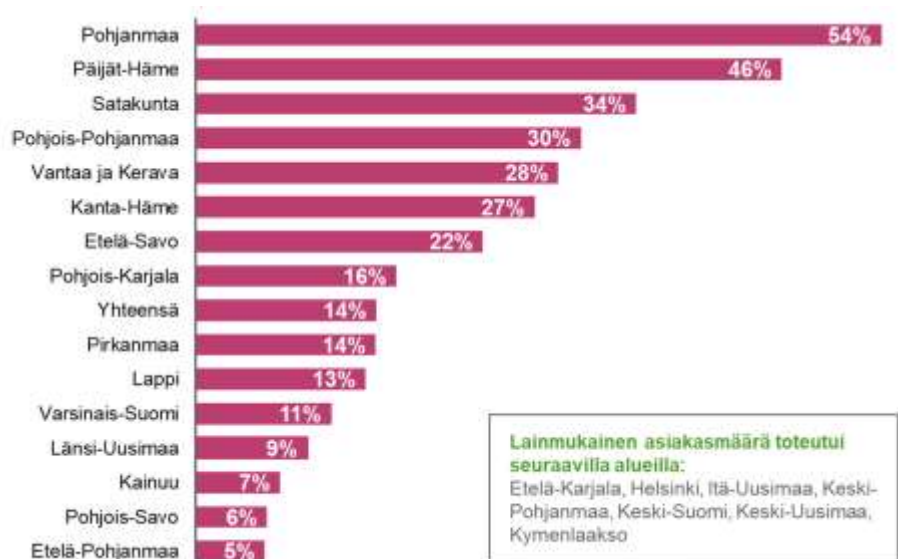
Kuvio 1. Osuus lastensuojelun sosiaalityöntekijöistä, joiden asiakasmäärä ylitti lakisääteiset 35 asiakasta, tilanne 8.11.2022 hyvinvointialueittain

Vuoden 2022 alusta lukien sosiaalityöntekijällä on saanut olla samanaikaisesti asiakkaana enintään 35 lasta. Vuoden 2024 alusta asiakkaita saa olla enintään 30. Uusi, hyvinvointialueiden antamiin tietoihin perustuva tilasto seuraa vastedes puolivuositain, miten lastensuojelun sosiaalityön henkilöstömitoitus toteutuu hyvinvointialueilla. Tiedot kysytään jatkossa huhtikuun ja lokakuun tilanteesta.