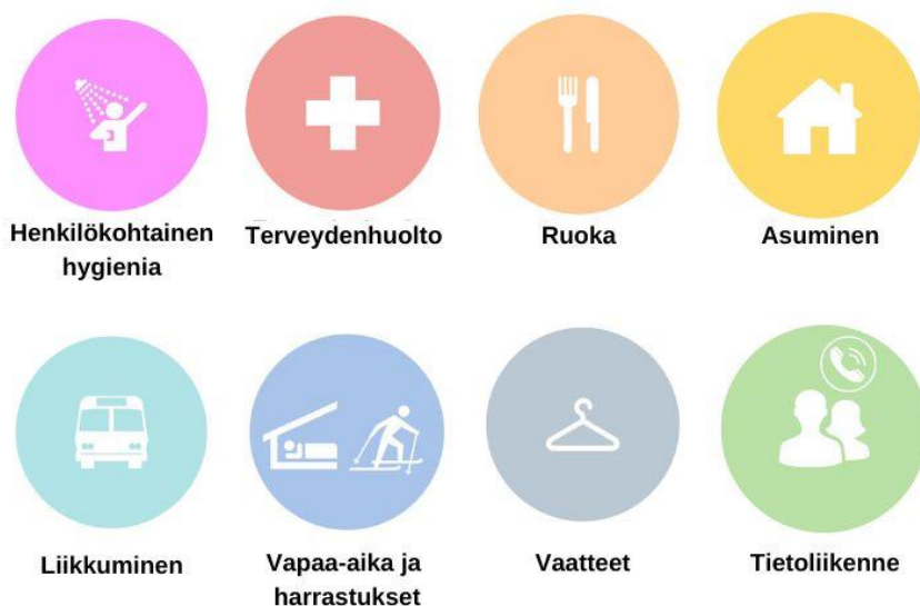
Kuvio 3. Viitebudjettitutkimuksessa laaditut hyödykekorit.

kuten kännykkä ja kannettava tietokone määriteltiin sosiaalisten suhteiden koriin, ruoanvalmistamiseen ja säilytykseen liittyvät kodinkoneet ruokakoriin, pyykinpesuun liittyvät koneet ja tavarat vaatekoriin ja jotkut huonekalut, kuten sänky, levon ja vapaa-ajan koriin.