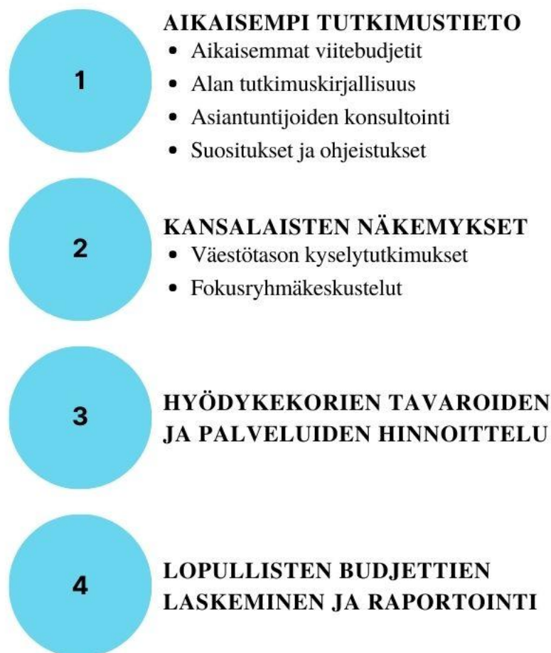
Kuvio 2. Prosessikaavio viitebudjettihankkeen etenemisestä.

Tietopohjien hierarkiassa on eroja eri organisaatioiden laatimien viitebudjettien välillä. Kuluttajatutkimuskeskuksen viitebudjetteja nimitetään konsensuaalisiksi, sillä ne perustuvat fokusryhmien konsensuskseen viitebudjettien sisällöstä. KTK:n viitebudjeteissa kansalaisten näkemykset saivat suurimman painoarvon, kun taas Turun yliopiston viitebudjeteissa hyödynnetty tietopohja on laajempi. Viitebudjetissamme tämä kansalaisilta kerätyn tiedon ja asiantuntijatiedon välinen suhde kuitenkin vaihtelee sen mukaan, missä määrin asiantuntijatietoa on saatavilla ja sitä on mielekästä hyödyntää viitebudjettien rakentamiseen. (Bakkum ym. 2022.)