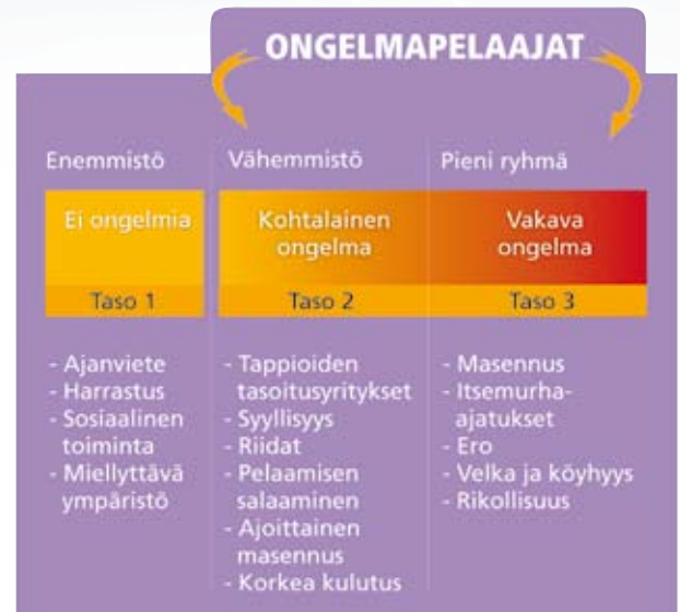
Pelaamisen tasot

Ongelmapelaaminen on rahan- ja/tai ajankäytöltään liiallista pelaamista, joka vaikuttaa kielteisesti pelaajaan, hänen läheisiinsä tai muuhun sosiaaliseen ympäristöön. Nämä kielteiset vaikutukset liittyvät usein talouteen, suorittamiseen opinnoissa tai työelämässä sekä fyysiseen ja psyykkiseen terveyteen. Peliriippuvuudesta puhutaan silloin, kun ongelmat ovat vakavia. Pelaamisen haitallisuus voi vaihdella samalla pelaajalla eri aikoina.